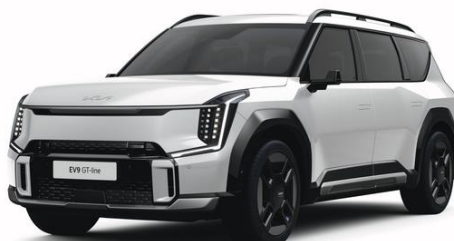
Snow White (SWP) metalizowany