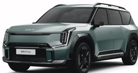
Iceberg Green (IEG) metalizowany