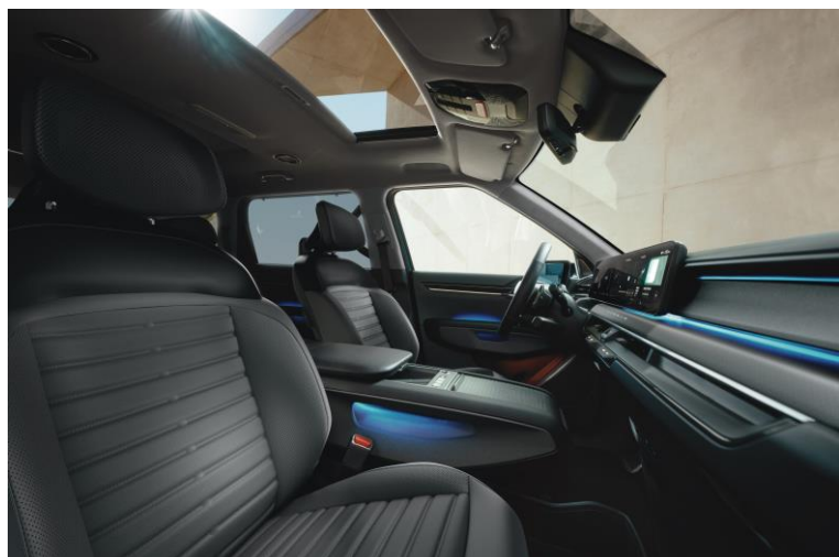
Wersja Earth wnętrze RBQ, opcja CP1