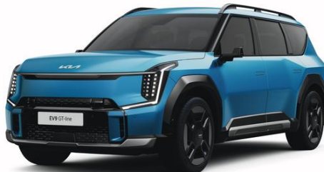
Ocean Blue (OBM) matowy, nieдоступny dla Earth