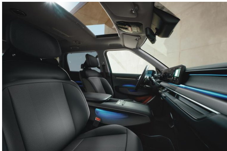
Wersja Earth wnętrze RBQ