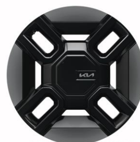
21" felgi aluminiowe (GT-Line)