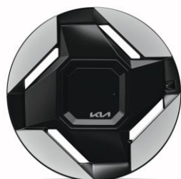
19" felgi aluminiowe (Earth)