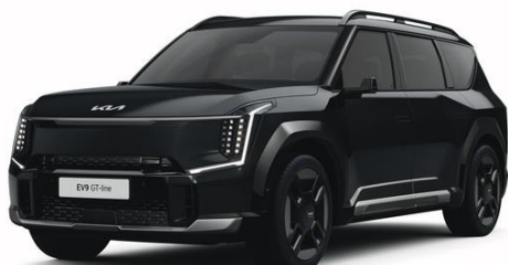
Aurora Black (ABP) metalizowany