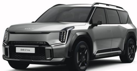
Pebble Grey (DFG) metalizowany