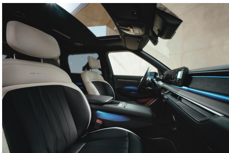
Wersja GT-Line wnętrze RBQ