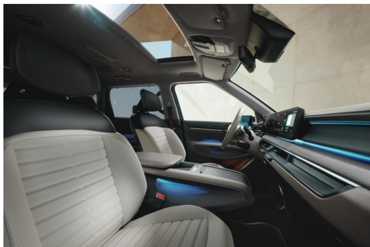
Wersja Earth wnętrze EMA, opcja CP1