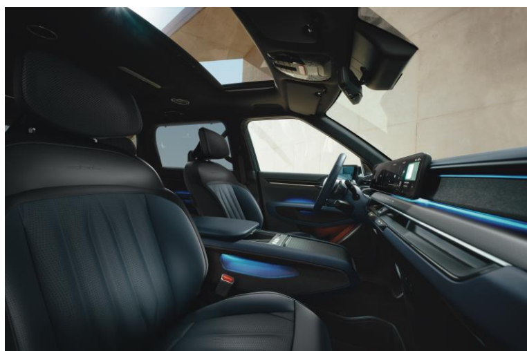
Wersja GT-Line wnętrze NJR